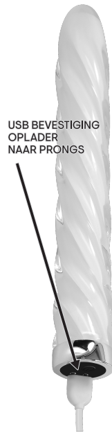
USB BEVESTIGING OPLADER NAAR PRONGS

OPLAADINSTRUCTIES: Het wordt aanbevolen om dit speelgoed voor het eerste gebruik op te laden. Om op te laden sluit u de USB stekker aan één uiteinde aan op een stroombron en het magnetische uiteinde op de oplaadpinnen aan de onderkant van het speelgoed. Het eerste opladen duurt ongeveer een uur; daaropvolgende kosten ongeveer 90 minuten. Het indicatielampje knippert terwijl het apparaat wordt opgeladen en blijft constant branden als het speelgoed volledig is opgeladen.