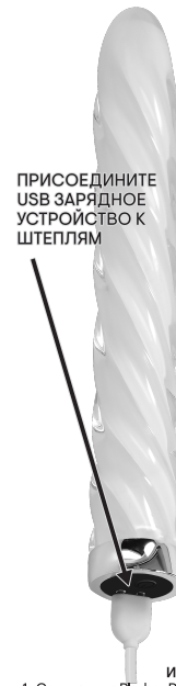
ПРИСОЕДИНИТЕ USB ЗАРЯДНОЕ УСТРОЙСТВО К ШТЕПЛЯМ

ИНСТРУКЦИЯ ПО ЗАРЯДКЕ: Перед первым использованием рекомендуется зарядить игрушку. Для зарядки подключите USB штекер к источнику питания на одном конце, а магнитный конец — к контактам для зарядки в основании игрушки. Первоначальная зарядка займет около часа; последующие сборки около 90 минут. Световой индикатор будет мигать, пока устройство заряжается, и будет гореть постоянно, когда игрушка полностью заряжена. Зарядка хватает примерно на 50 минут игрового времени при максимальном уровне вибрации и на 60 минут при минимальном уровне. Эта игрушка работает с уровнем звука 60 дБ благодаря перезаряжаемой литиевой батарее емкостью 170 мАч и напряжением 3.7 В.