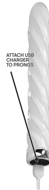
ATTACH USB CHARGER TO PRONGS

CHARGING INSTRUCTIONS: It is recommended to charge this toy before first use. To charge, connect the USB plug to a power source at one end and the magnetic end onto the charging pins at the base of the toy. Initial charge will take about an hour to complete; subsequent charges about 90 minutes. The indicator light will flash while device is charging and stay constant when toy is fully charged.