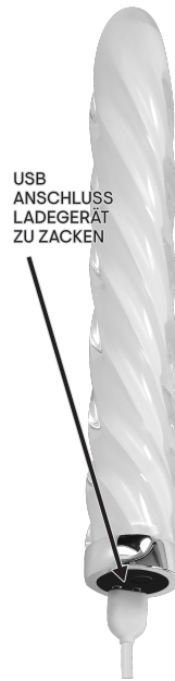
USB ANSCHLUSS LADEGERÄT ZU ZACKEN

LADEANLEITUNG: Es wird empfohlen, dieses Spielzeug vor dem ersten Gebrauch aufzuladen. Zum Aufladen schließen Sie den USB-Stecker an einem Ende an eine Stromquelle und das magnetische Ende an die Ladestifte an der Unterseite des Spielzeugs an. Der erste Ladevorgang dauert etwa eine Stunde. Nachladungen ca. 90 Minuten. Die Kontrollleuchte blinkt, während das Gerät aufgeladen wird, und bleibt konstant, wenn das Spielzeug vollständig aufgeladen ist. Der Ladevorgang reicht für etwa 50 Minuten Spielzeit auf der höchsten Vibrationsstufe und 60 Minuten auf der niedrigsten Stufe. Dieses Spielzeug arbeitet mit einem Schallpegel von 60 dB und einer wiederaufladbaren 170-mAh-Lithium-Batterie bei 3.7 V.